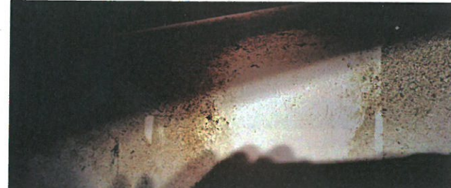
ボタニカルクリーンネス原液を指に取り、触れただけでもこの通り。素手で直接洗剤に触れても肌荒れが無い。