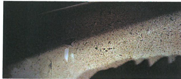
レンジ横の壁面。食用油の飛び散りがある。市販の油汚れ用洗剤で落とさきれず。

洗浄力判定用指標洗剤(鉱物系合成界面活性剤を使用した洗剤)と比較し明らかにまさる場合「+2」、ややまさる場合「+1」、ほとんど差がない場合「0」、やや劣る場合「-1」、明らかに劣る場合「-2」の5段階で評価。